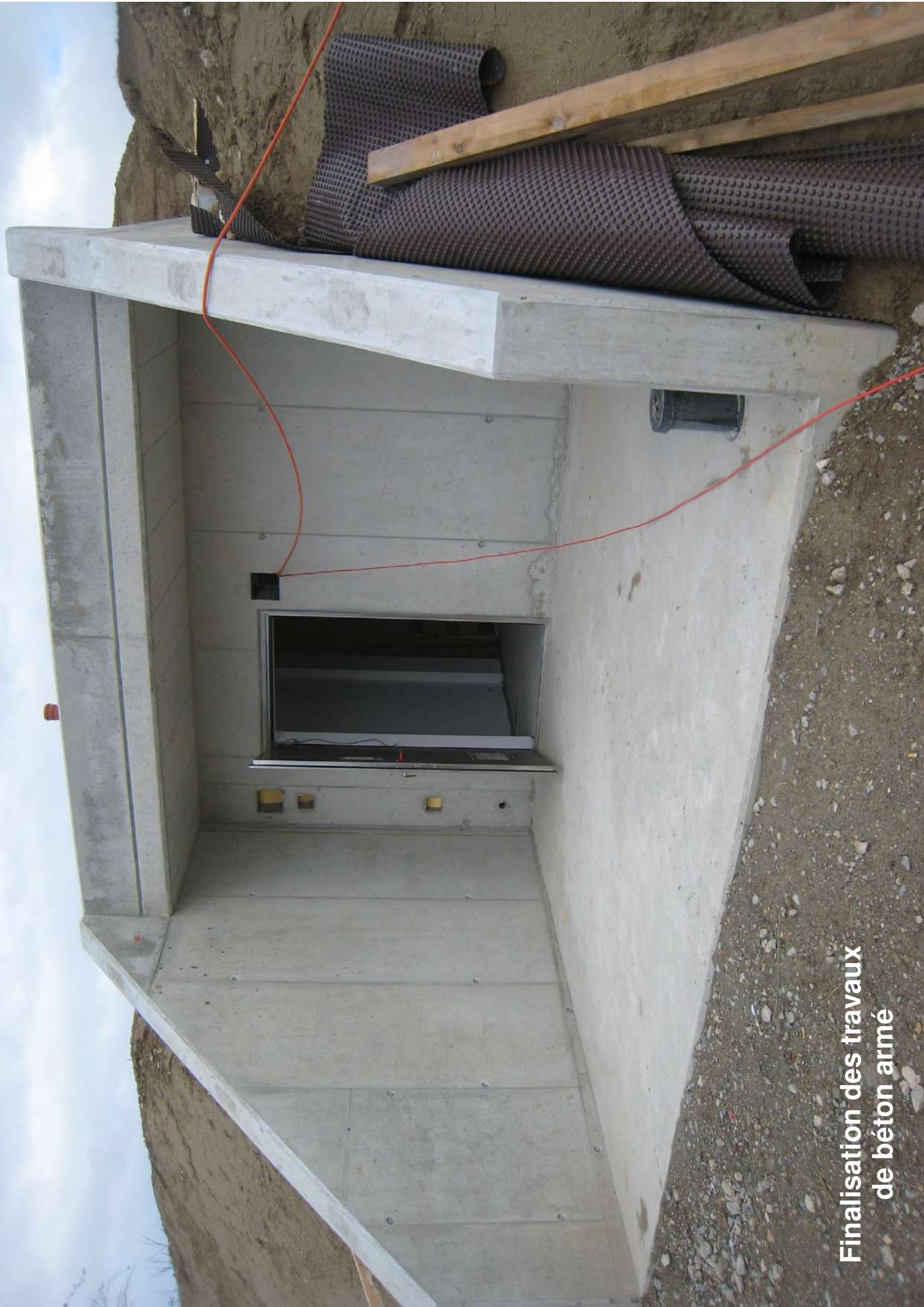
Finalisation des travaux de béton armé