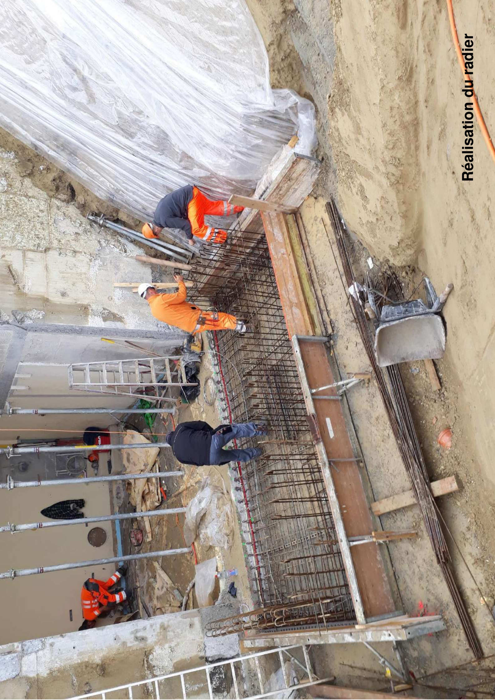
Réalisation du radier