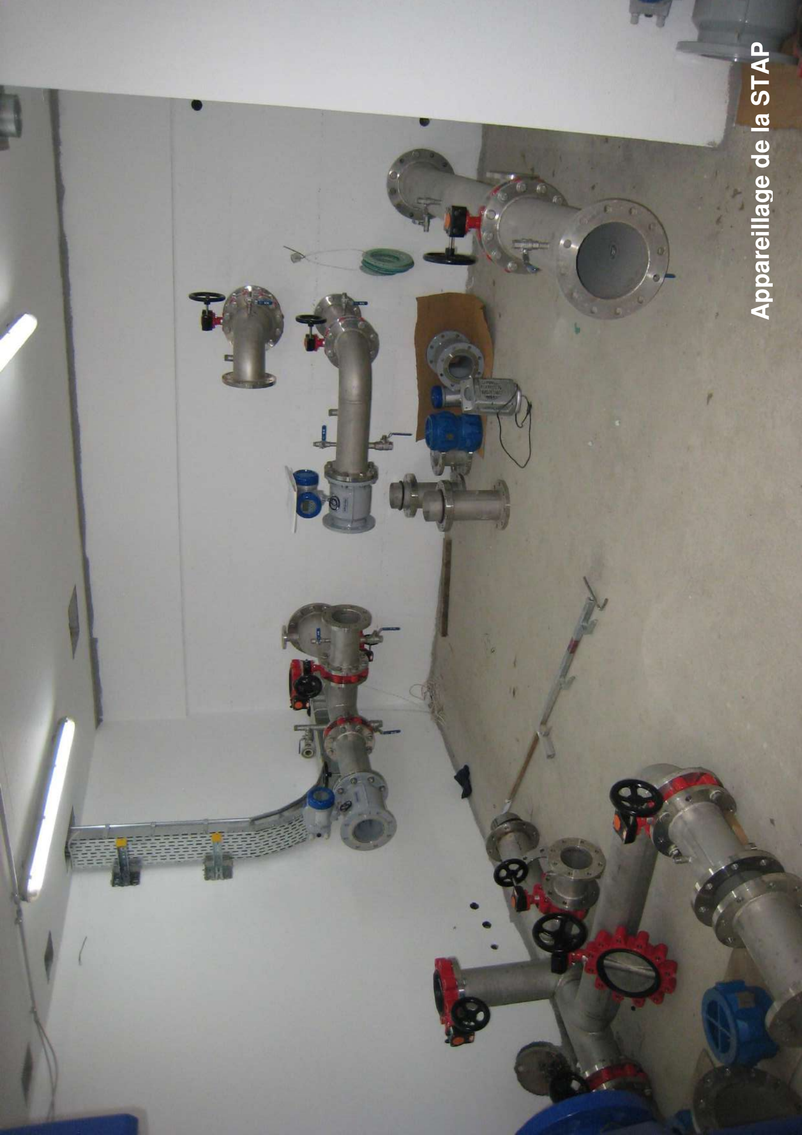
Appareillage de la STAP