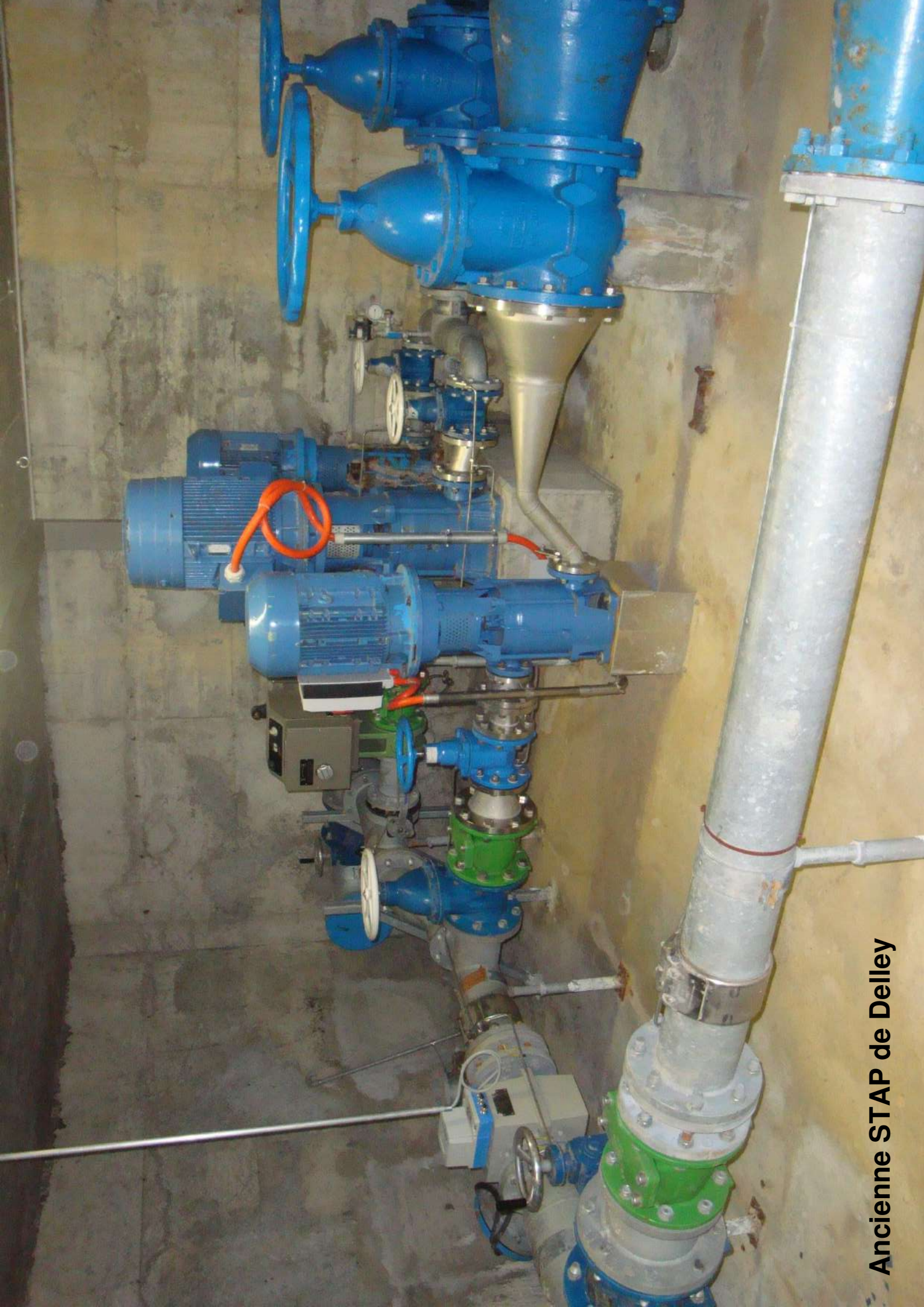
Ancienne STAP de Delley