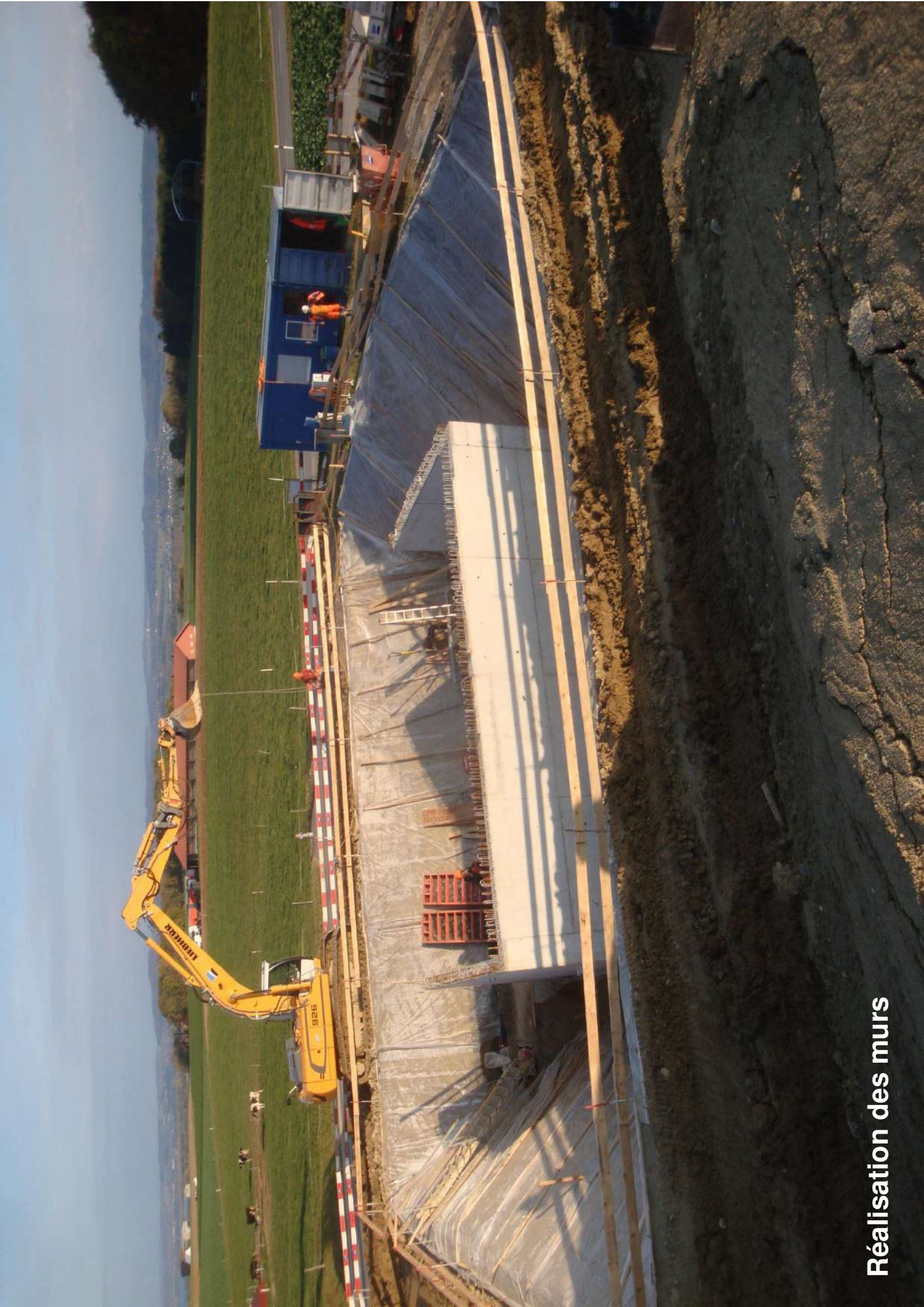
Réalisation des murs