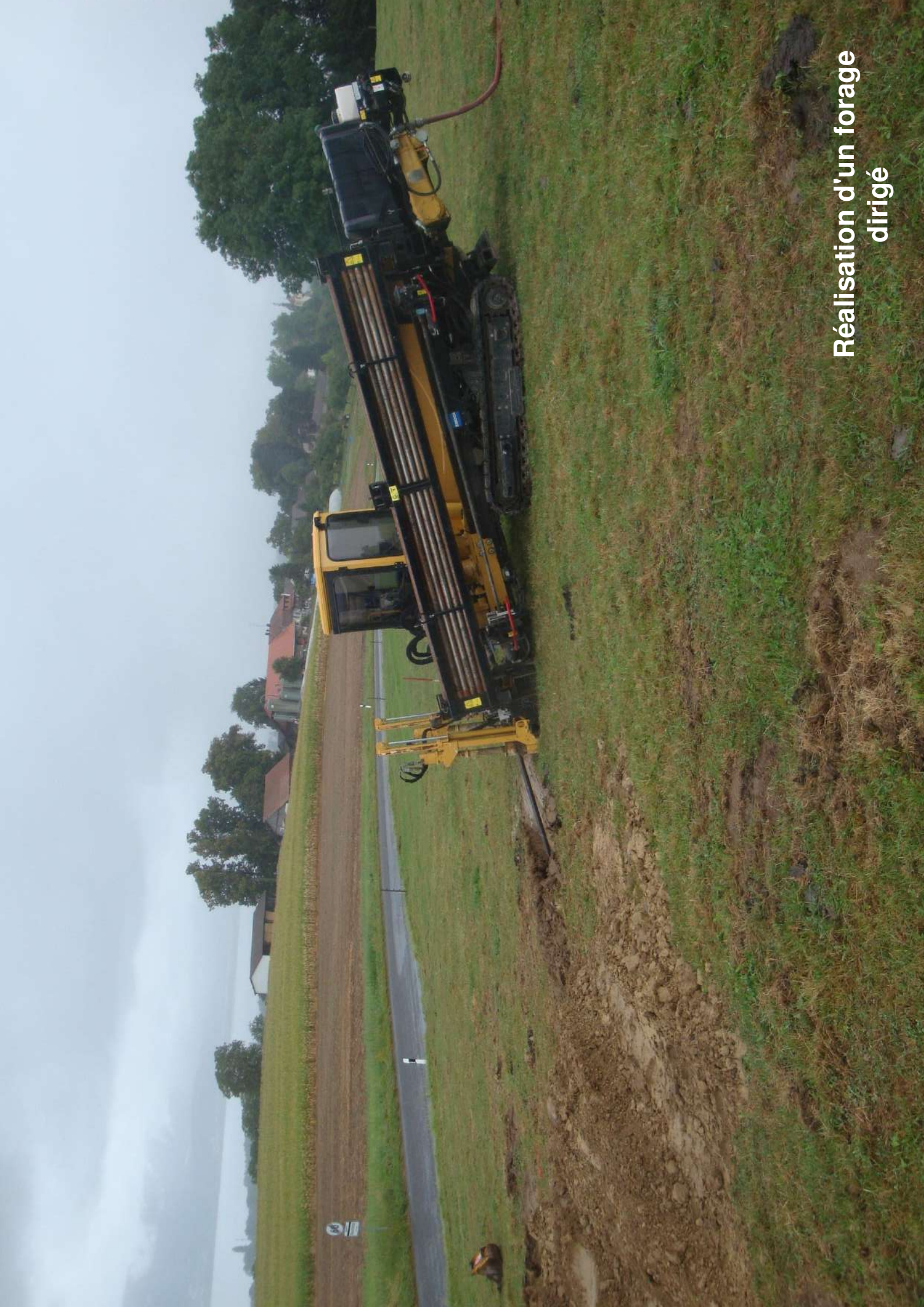
Réalisation d'un forage dirigé