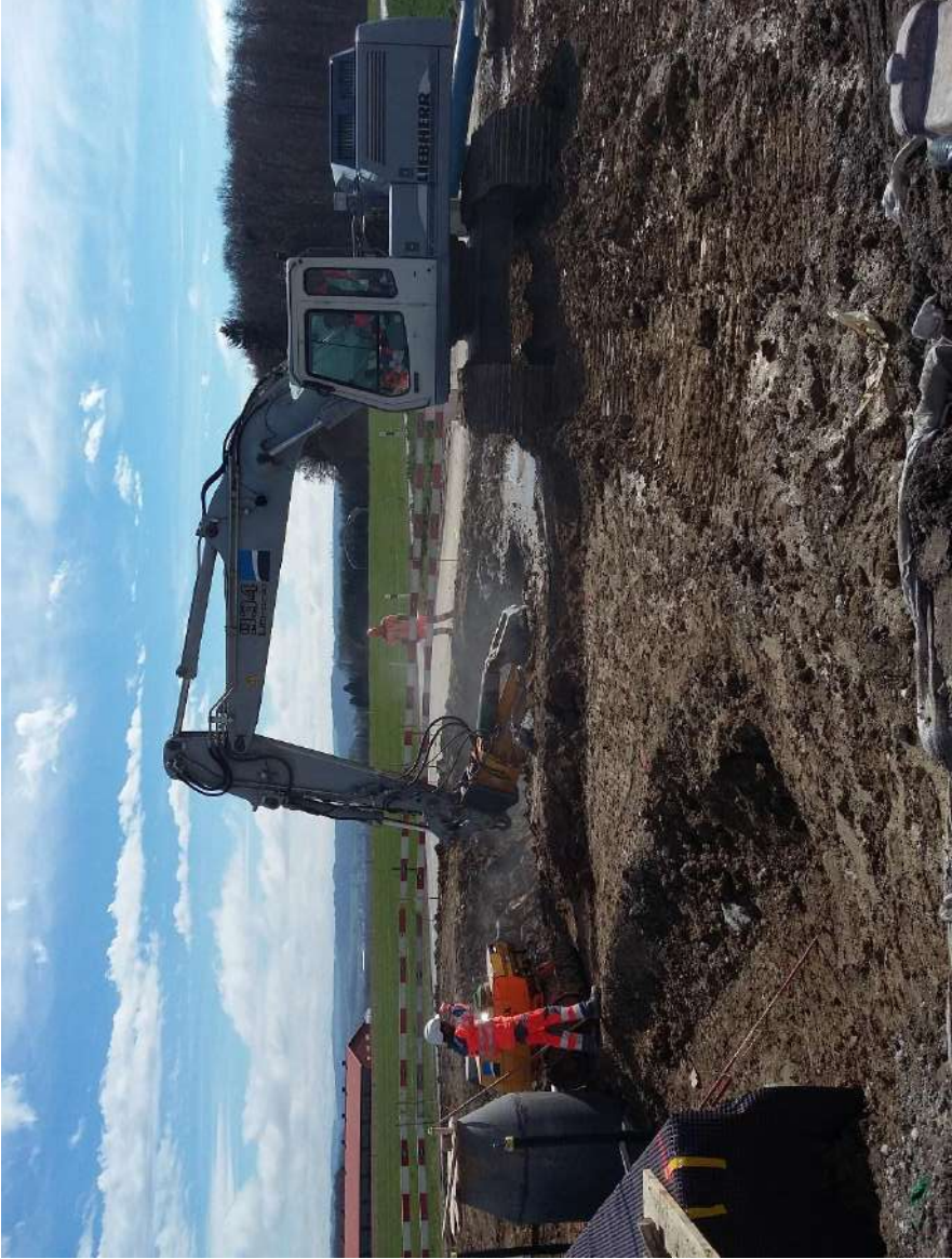
Démolition de l'ancienne STAP