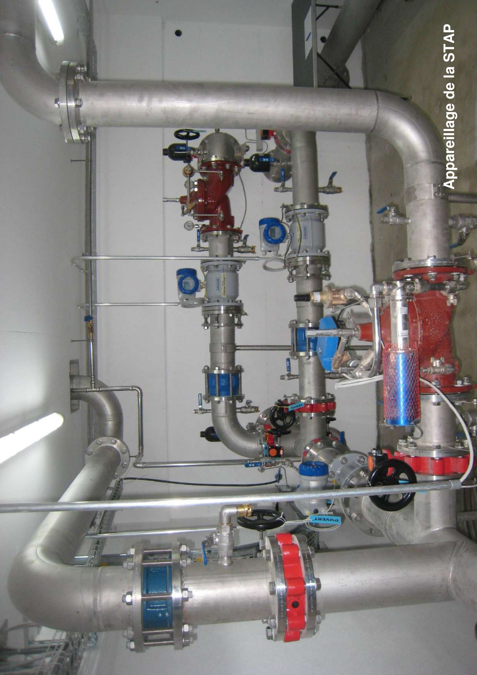
Appareillage de la STAP