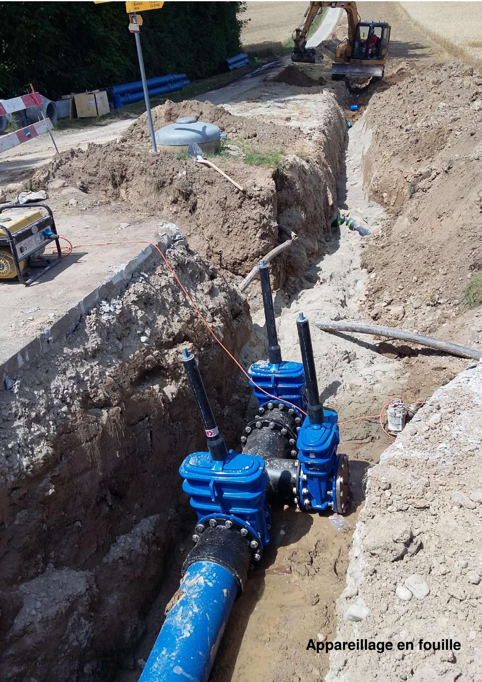
Appareillage en fouille