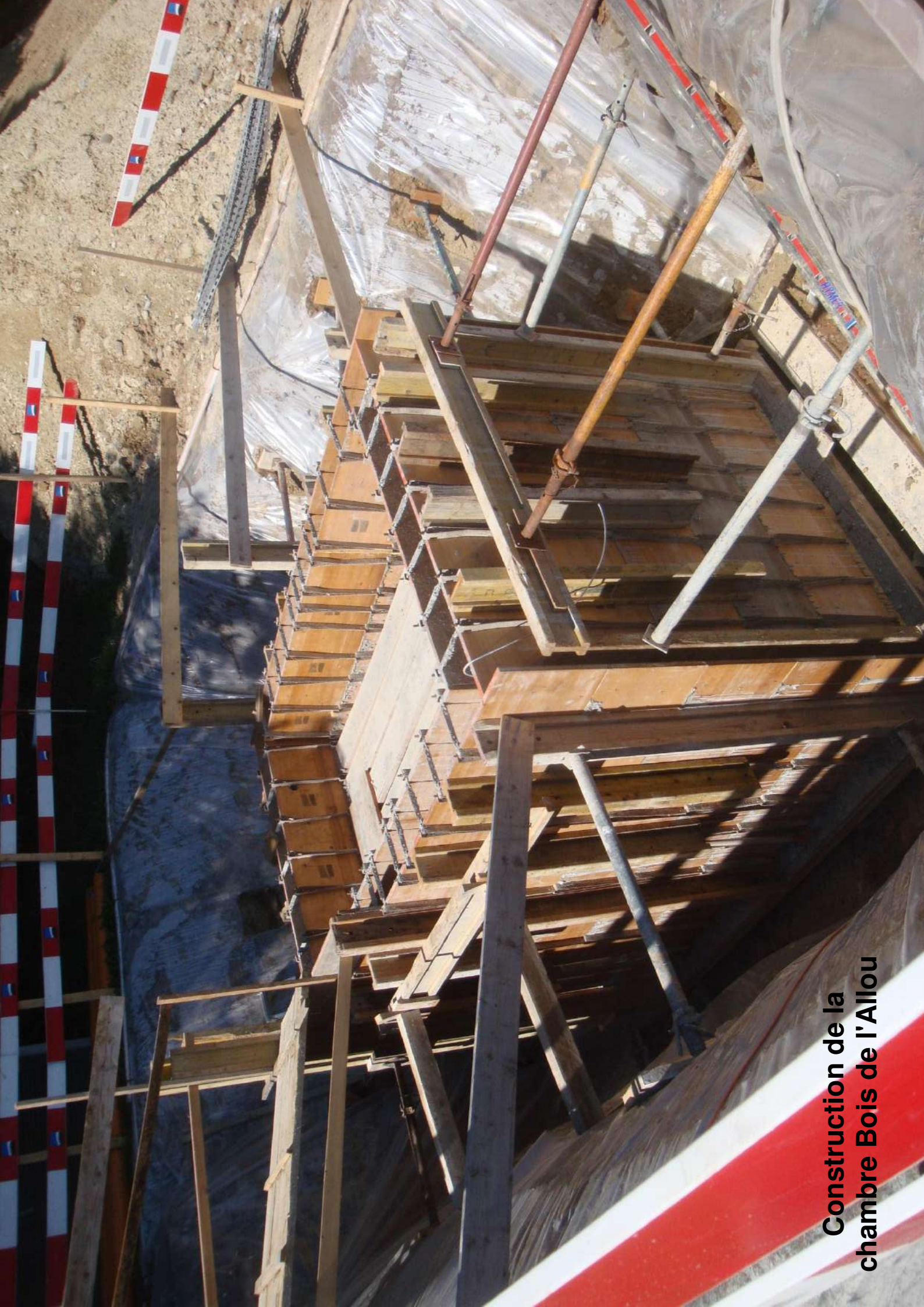
Construction de la chambre Bois de l'Allou