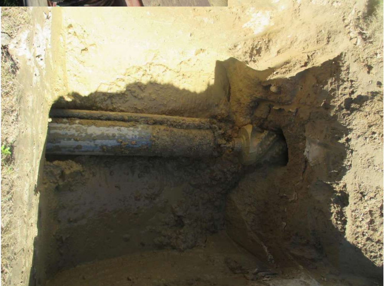
Réalisation d'un forage dirigé