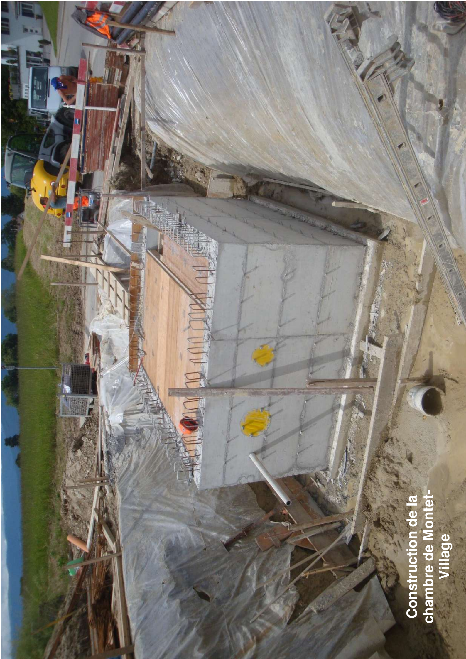
Construction de la chambre de Montet- Village